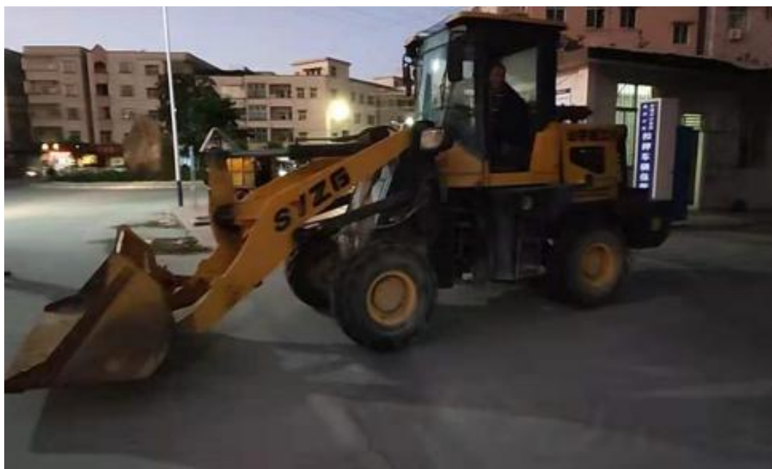
图6 驻车制动性能试验