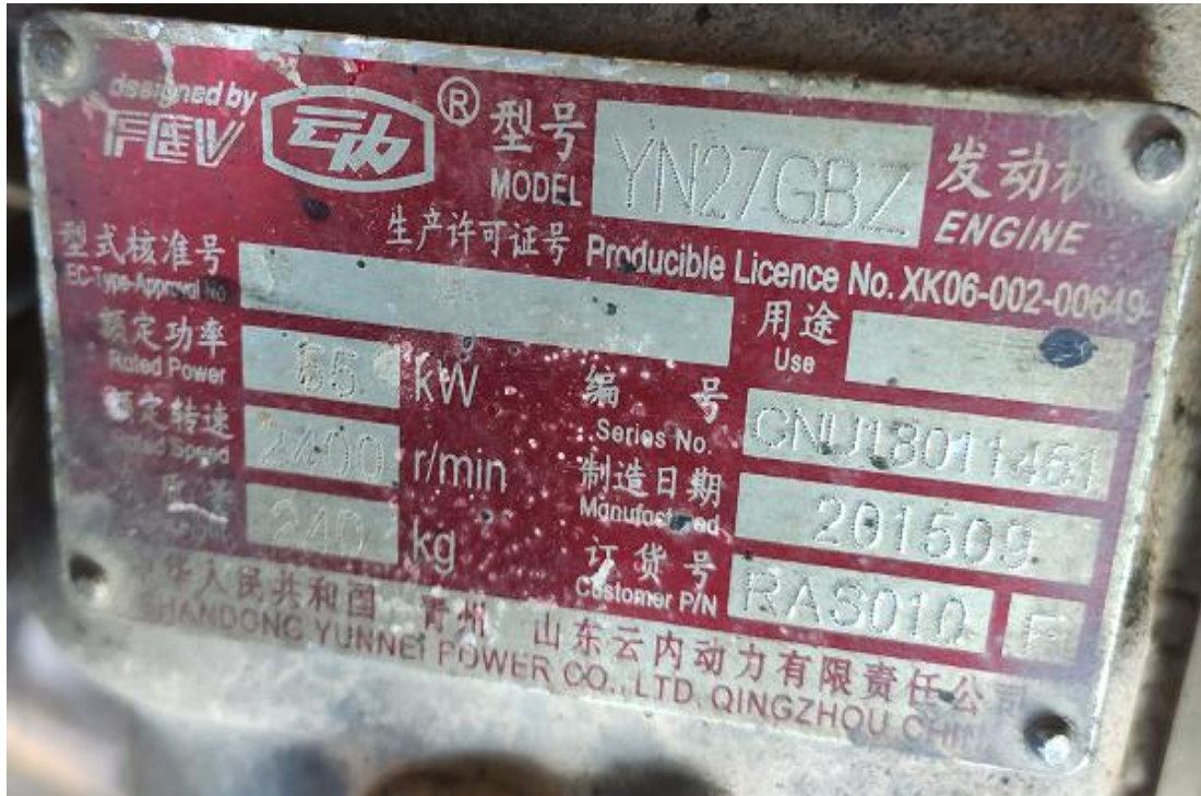
图 3 涉事铲车发动机铭牌

据陈仿华与涉事车辆销售店负责人马松强笔录显示，涉事车辆为陈仿华所有。陈仿华未能提供涉事车辆的产品质量合格证明、使用维护说明书等出厂随机资料，陈仿华与涉事车辆销售店均未能提供涉事车辆买卖相关凭证。