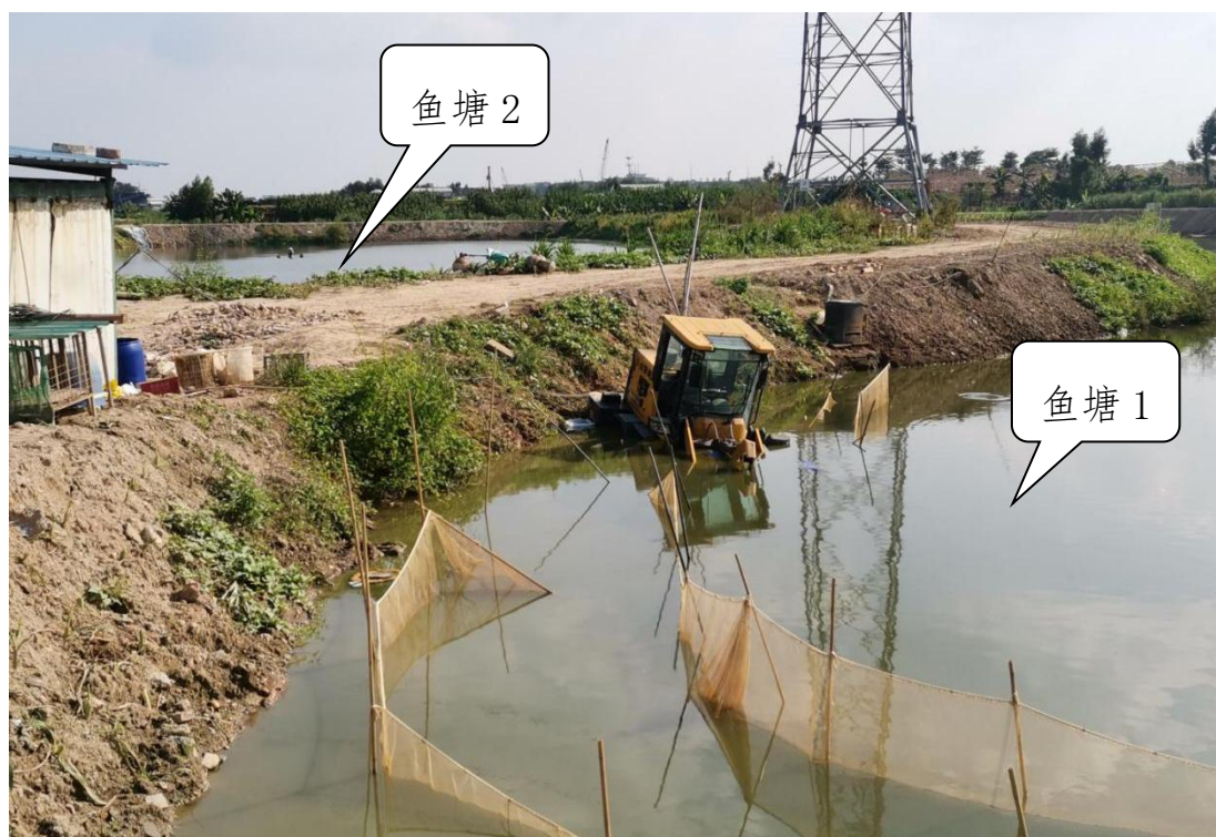
图 4 事发现场

转移到西面第二口鱼塘（以下简称“鱼塘 2”）。吴国金、陈云富等 6 人先按陈仿华要求把“鱼塘 1”的鱼苗挑选出来放到塑料桶里,再由陈仿华驾驶铲车将装鱼苗的塑料桶转移到“鱼塘 2”。10 时 10 分许,陈仿华将铲车停在“鱼塘 1”旁边,下车督促吴国金、陈云富等 6 人加快作业速度,随后铲车滑落“鱼塘 1”,撞击、挤压吴国金、陈云富 2 人。涉事铲车下滑后,陈仿华进入铲车驾驶室,打算把铲斗拉高,因担心涉事铲车继续下滑,未作操作。陈仿华随即前往寻求附近作业的挖掘机协助救援,大约 10 多分钟后挖掘机达到现场,将涉事铲车抬高,陈仿华等人将陈云富、吴国金陆续抬上岸。10 时 31 分,横沥医院医护人员到达现场;10 时 36 分,确认吴国金、陈云富 2 人死亡。