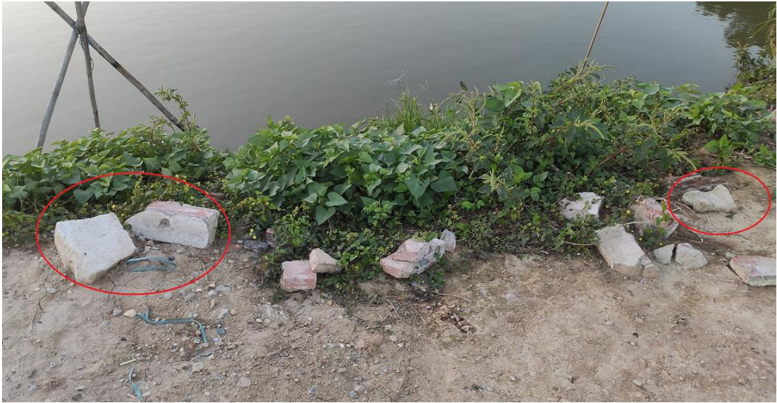
图 7 防止车辆下滑的阻挡石头