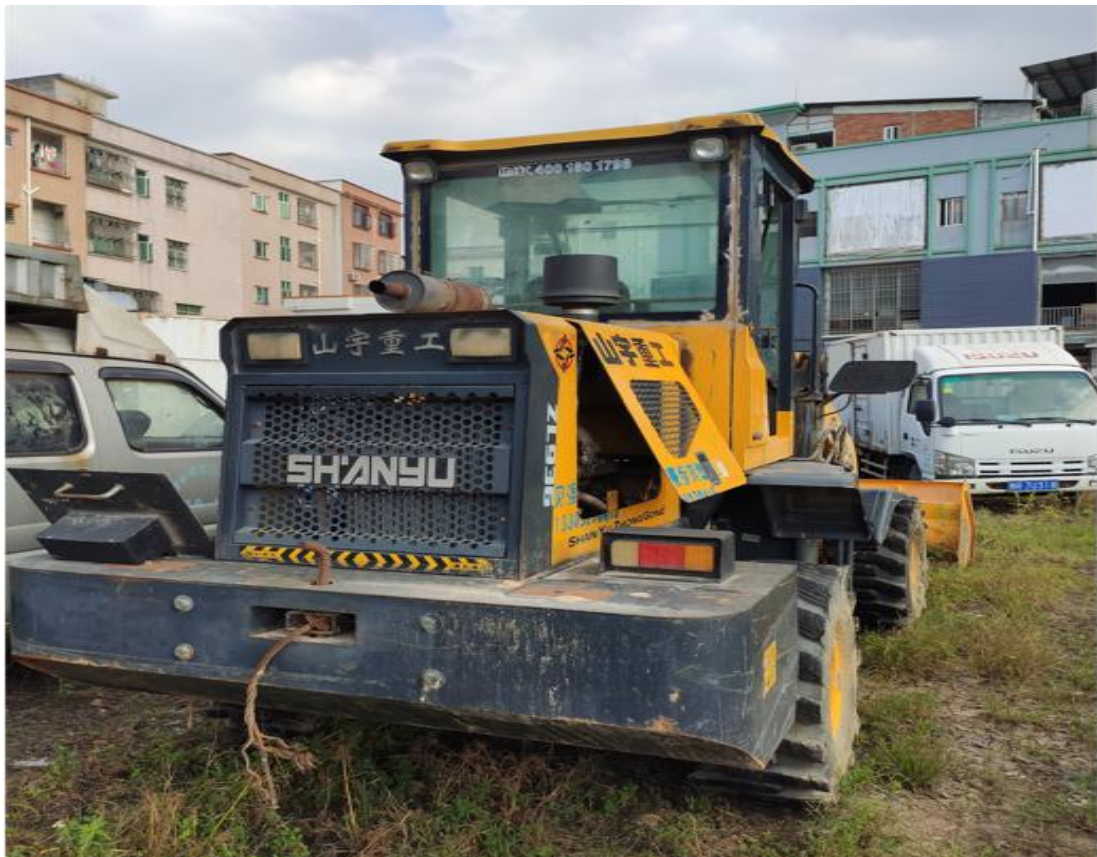
图 2 涉事铲车

涉事车辆为一台铲车（图 2），型号为 ZL936，车身有“山宇重工”标识，发动机型号为 YN27GBZ、发动机编号为 CNU18011451（图 3）。