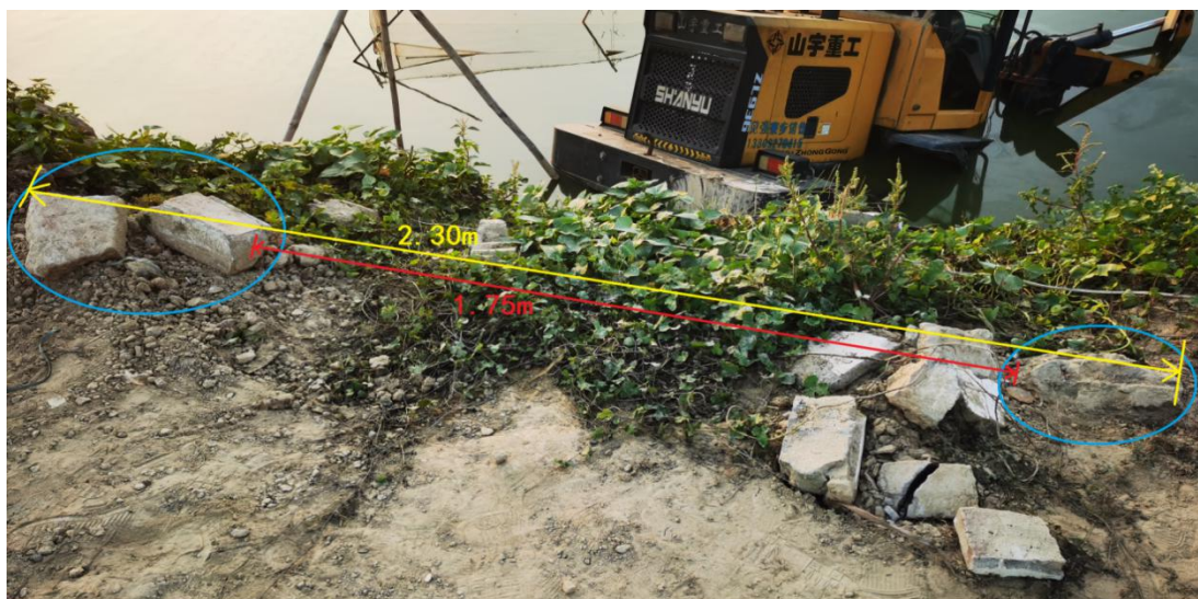
图5 阻挡石头距离示意图

6.根据《广东康怡司法鉴定中心车辆安全技术检验鉴定意见书》（康怡司鉴中心〔2021〕安检意见第3234号），涉事铲车手刹制动装置制动功能失效。