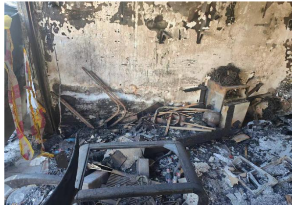
图 5 事故现场燃烧物品