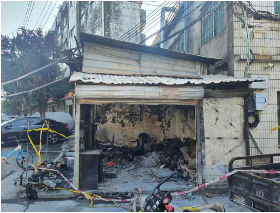
图 2 起火建筑物