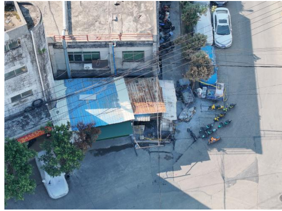
图 3 起火建筑物俯视图