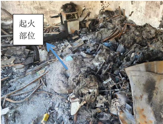
图 4 事故现场燃烧中心图