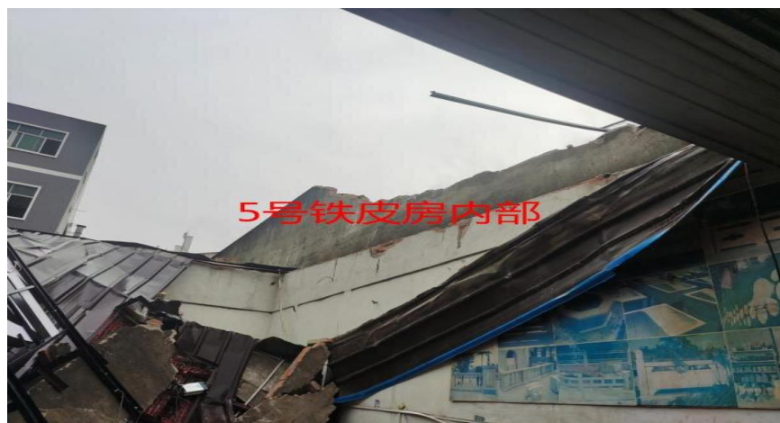
图 7 5 号铁皮房内坍塌情况