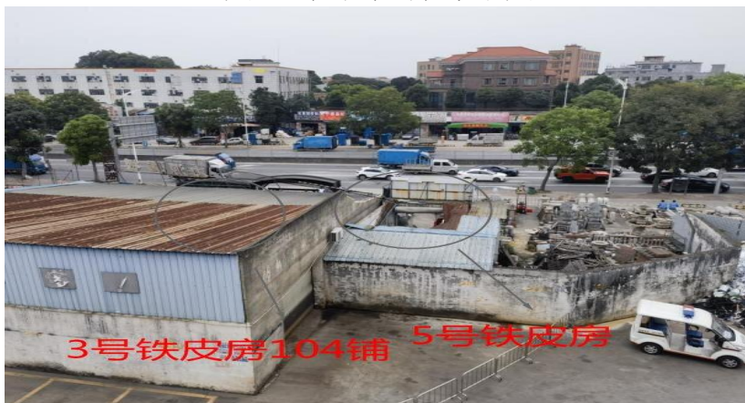
图4 事发现场5号铁皮房外部