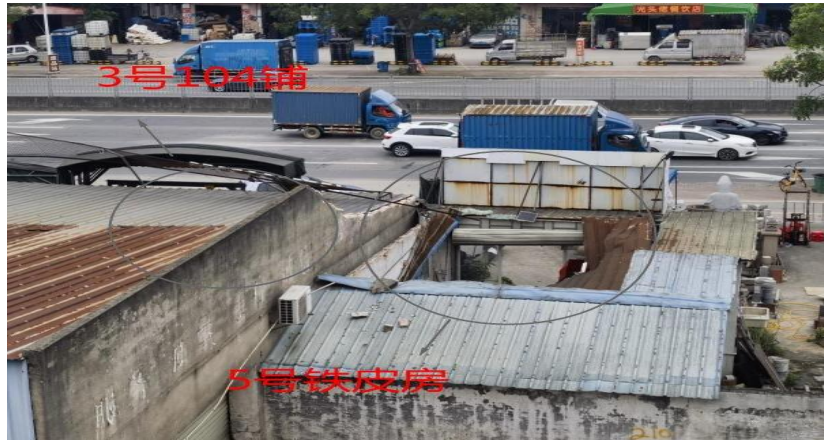
图 5 事发现场 5 号铁皮房外部