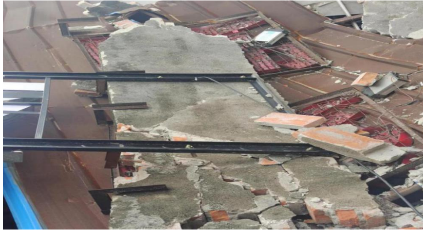
图 8 在山墙上安装设置的广告牌