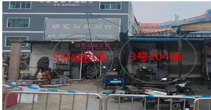
图 6 涉事 3 号、5 号铁皮房正面情况