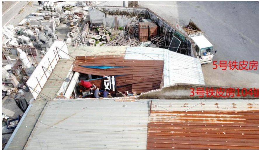
图3 事故现场鸟瞰图

经现场勘查证实，3号铁皮房 104号铺位坍塌的墙体上安装了广告牌，夕阳机械公司于2016年在该墙体侧面上安装了铁制“力源尾板”的广告牌，于2022年又在该墙体的上部安装了亚克力板材的“尾板”广告牌。现场情况见下列示图：图3、图4、图5、图6、图7、图8。