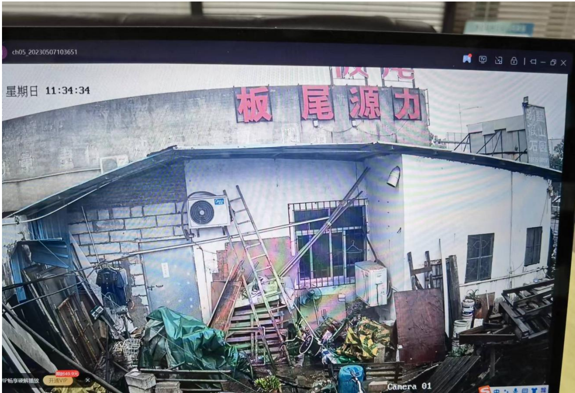
图 2 3 号铁皮房山墙坍塌前的情况

(2) 5 号铁皮房。 面积大约 57 平方米，紧邻 3 号铁皮房的 104 号铺位。据温浩良（业主）反映，2014 年，温浩良将 5 号铁皮房出租给许振飞（死者），主要是用于销售石材，不涉及生产和加工，约定的租赁期限为 2014 年至 2020 年（租赁合同已遗失），合同到期后许振飞一直没有搬离，之后没有签订续租合同，2022 年 10 月份之后，温浩良没有再收取许振飞的租金，并督促许振飞搬离，但许振飞一直没有搬走。