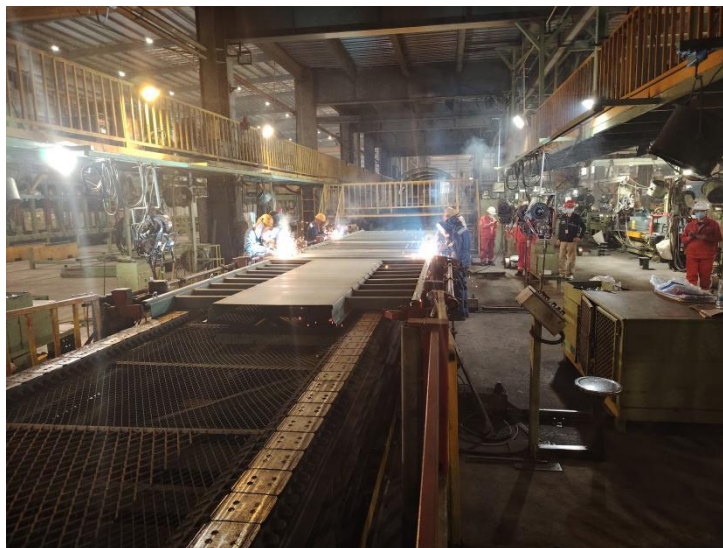
图 4 涉事设备图（设备已变动）