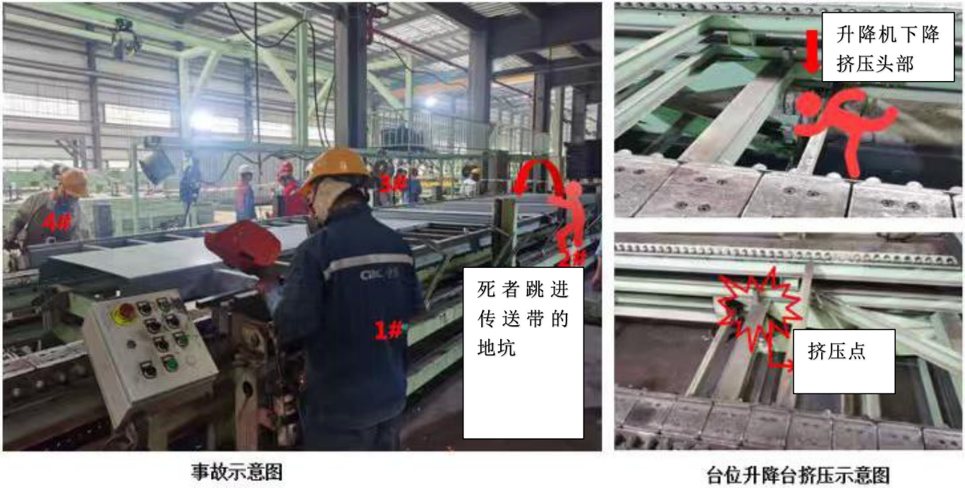
图 1 事故现场模拟图