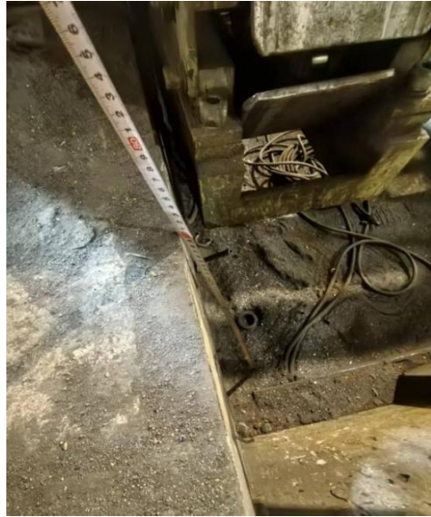
图2 地坑离地面约0.7米