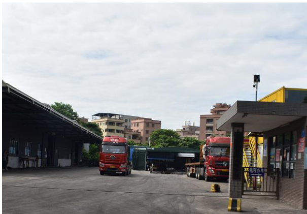
图 8 涉事车辆停放位置

[23]（如图 10），周新记从平板半挂车车面尾部跌落，经测量，平板半挂车车面尾部与跌落地面的距离约 1.2 米（图 11）。