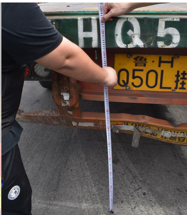
图 11 平板车车面与地面距离