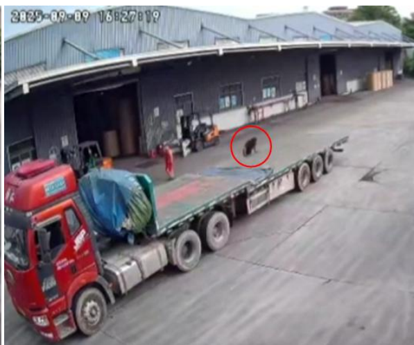
图 4 监控视频截图