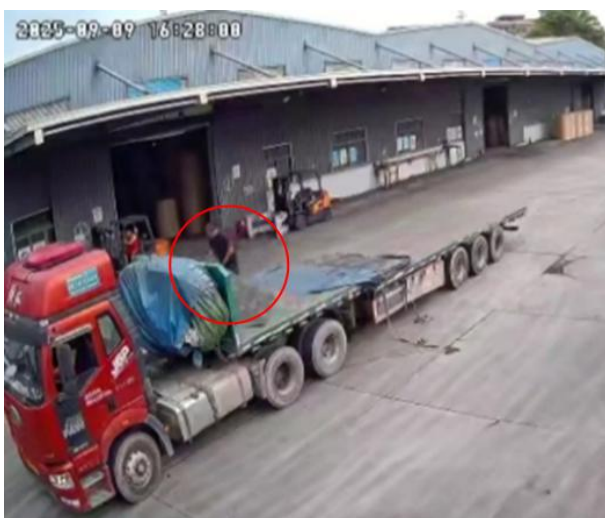
图 5 监控视频截图