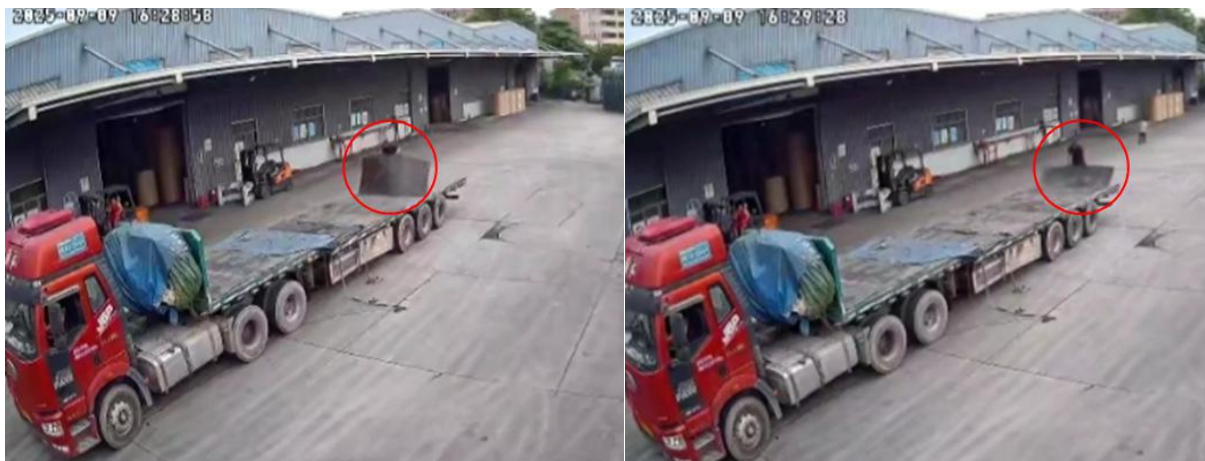
图 12 监控视频截图

事故调查组结合事故现场勘察、调查询问和事故现场监控视频等资料分析，排除刑事案件、人为故意破坏、突发灾害等因素的影响。