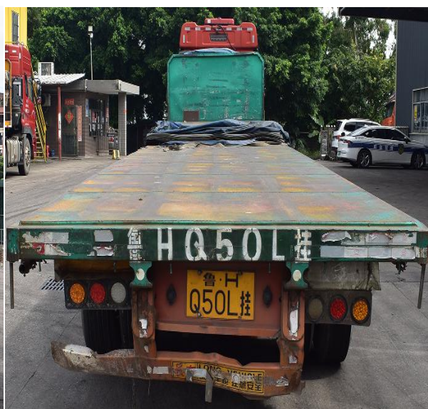
图 2 涉事重型平板半挂车