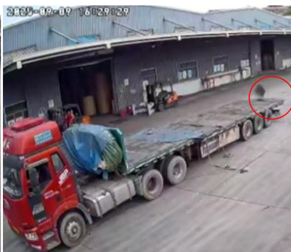
图 6 监控视频截图