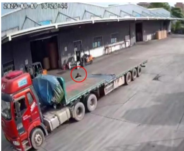
图 3 监控视频截图

16 时 29 分 29 秒，当橡胶软垫铺至平板半挂车尾部时，周新记在后退过程中踩空从平板半挂车车面跌落至地面（如图 6）。