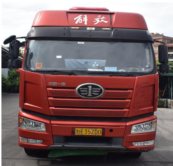
图 1 涉事重型半挂牵引车