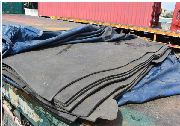
图 9 平板半挂车面铺设的软垫