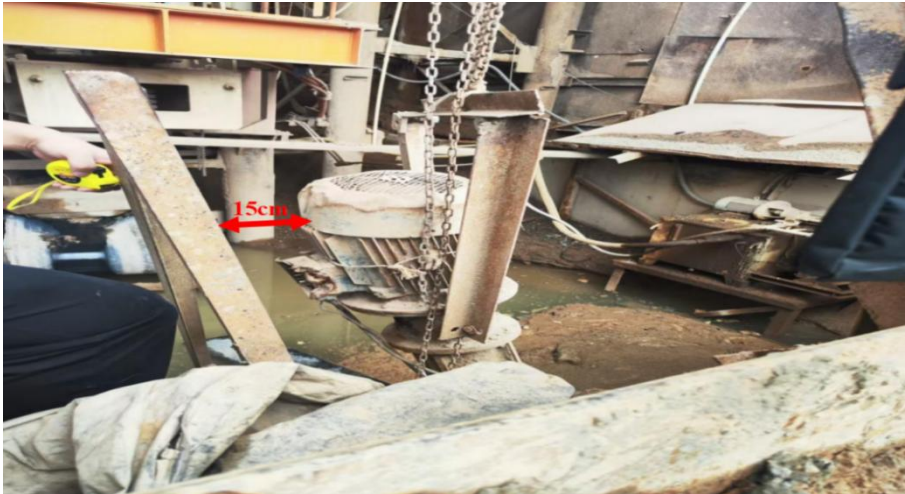
图 11 扶手与水泵

4.触电过程推断。制砂车间的抽水泵电动机外壳损坏且与电动机电源接线端一相碰到一起，致使电动机外壳带电；电动机外壳无接地线保护，且抽水泵电动机电源控制回路未安装漏电保护开关，电动机外壳带电断路器不会跳闸。当杨发庆一手触碰电动机外壳，一手扶角铁栏杆时电流在两手之间形成通路（如图 12），引起心室颤动、心脏聚停、失去知觉而摔下水坑。