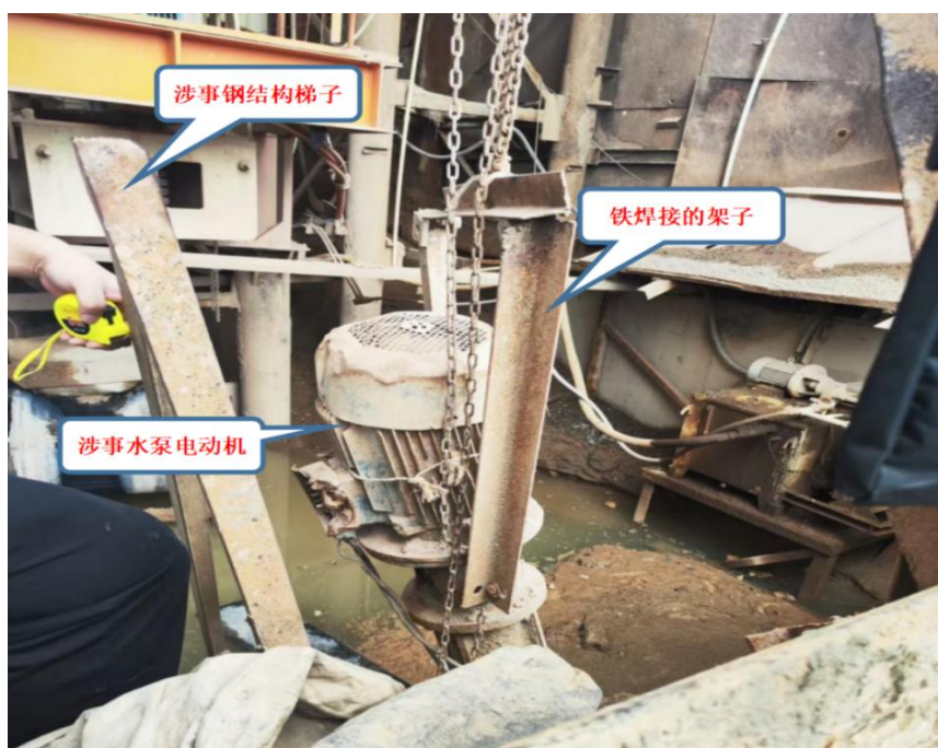
图 7 连盛公司制砂车间