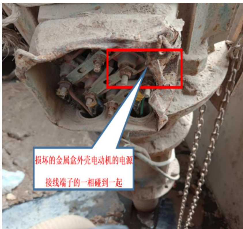
图 2 涉事抽水泵电源接线盒损坏情况