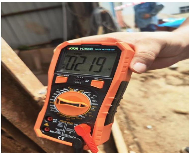
图 10 检测电动机外壳电压

2.经现场勘查，技术专家给抽水泵电动机通电后用数字万用表检测到电动机外壳对人体电压为 219\text{V}^{[17]} （如图 10）。