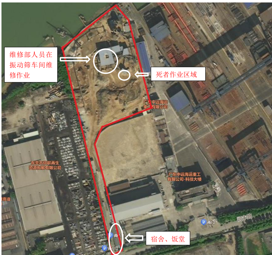
图 5 连盛公司平面图