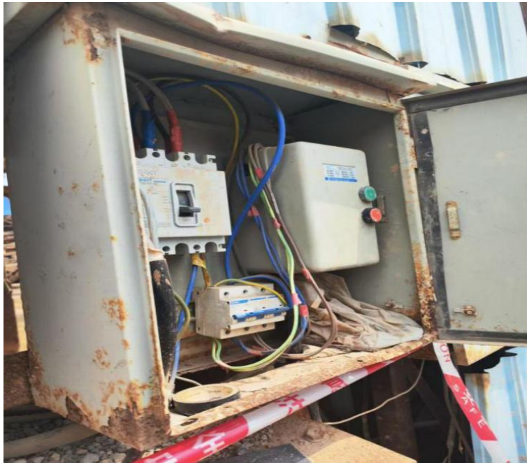
图 8 抽水泵配电箱图

配电箱内无接地保护装置，抽水泵电动机外壳无接地保护 [15] ，电箱外壳锈蚀，无警示标志 [16] 。抽水泵电源线无护套保护，直接拖放在地上（如图 9）。