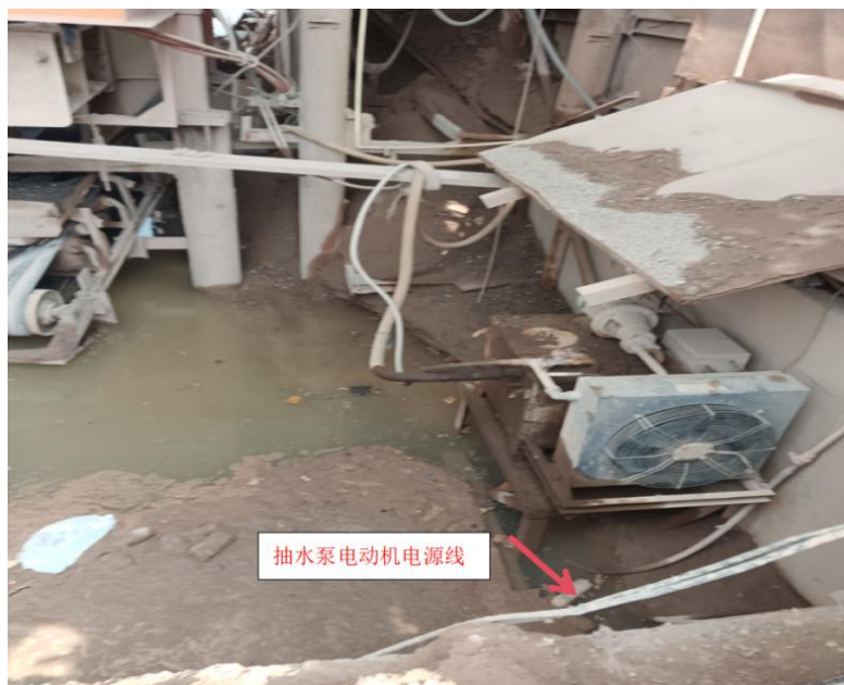
图 9 抽水泵电源线无护套保护

2.经现场勘查，技术专家给抽水泵电动机通电后用数字万用表检测到电动机外壳对人体电压为 219\text{V}^{[17]} （如图 10）。