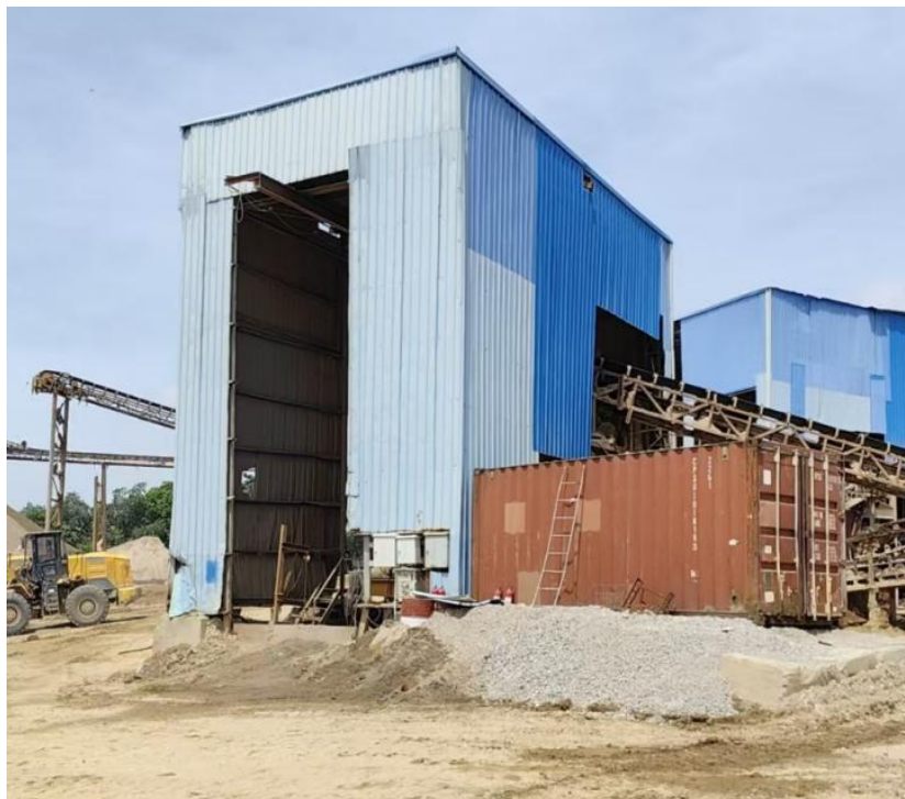
图 6 连盛公司制砂车间