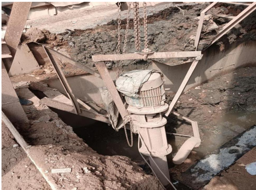
图 1 涉事抽水泵外观图