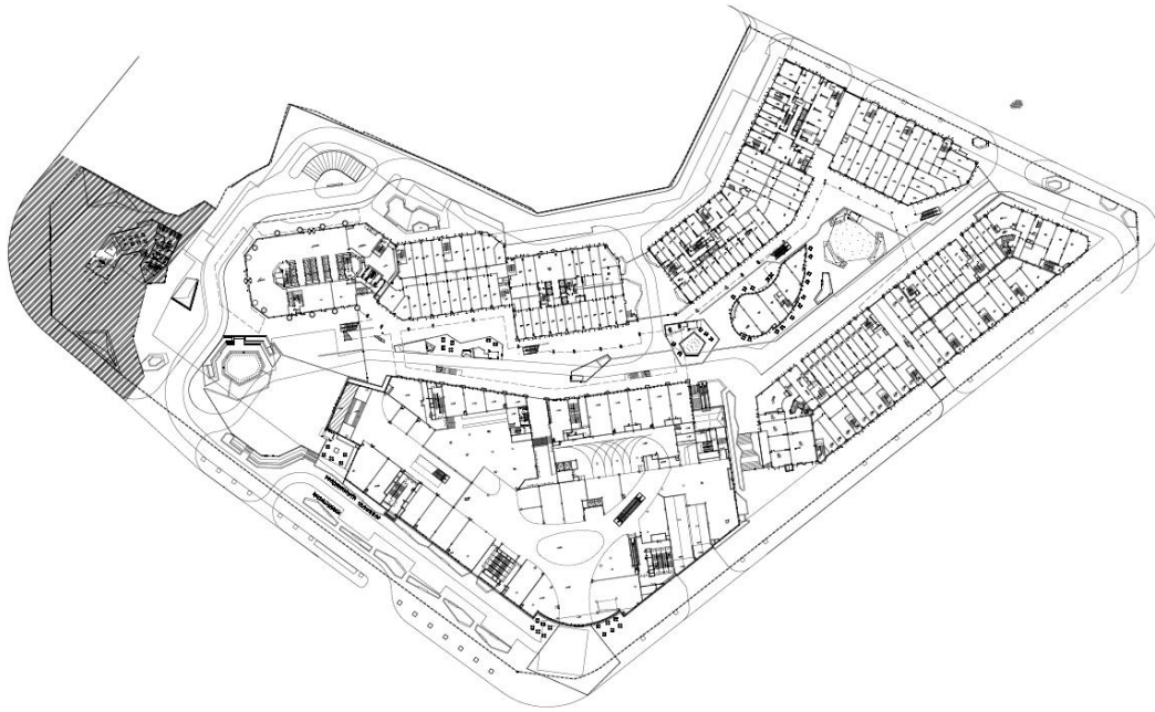
图1 涉事商住综合体平面图