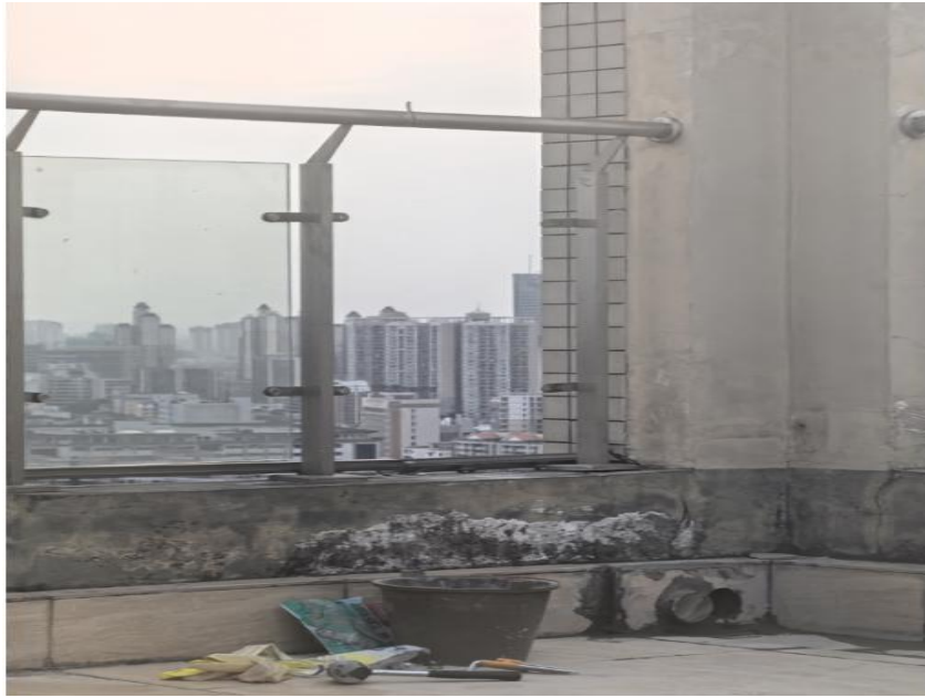
图 3 作业现场图片