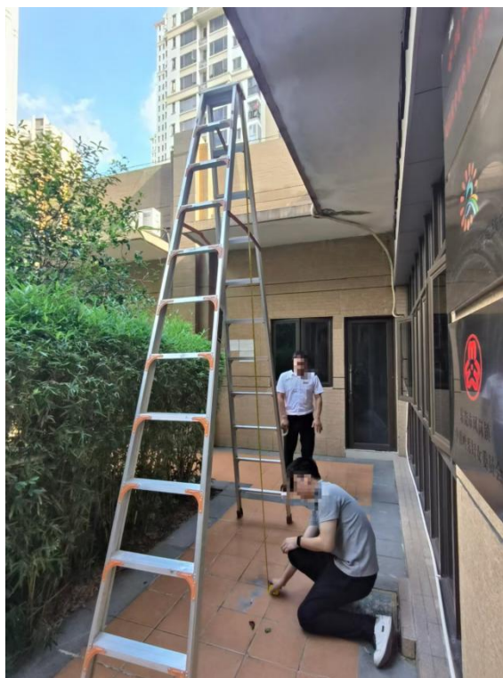
图 4 涉事人字梯的高度为 3.73 米