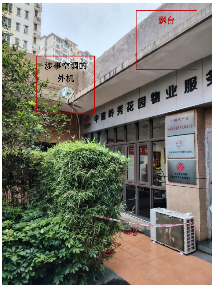
图 2 涉事物业管理中心办公室门口