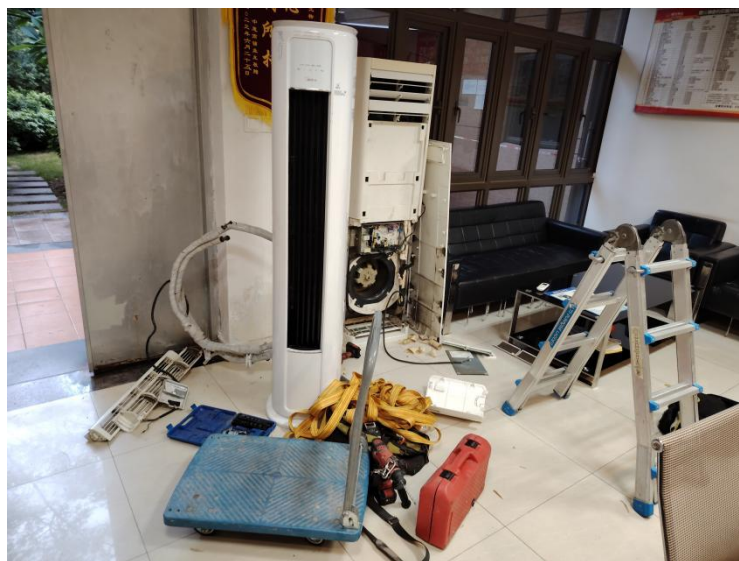
图 3 涉事空调内机（已被拆除面板）