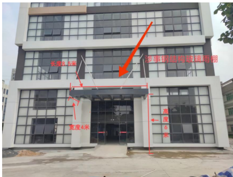
图 1 古艾公司扩建项目 3 号厂房涉事玻璃雨棚

涉事工程处于基本完工状态, 涉事的钢结构玻璃雨棚位于 3 号厂房首层主大门, 事发时已完成钢架施工, 只剩玻璃未安装。整个钢结构玻璃雨棚长约 8.5 米, 宽约 4 米, 高约 6 米。